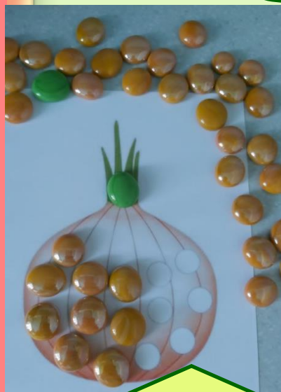
Трафареты Камушки Марплс