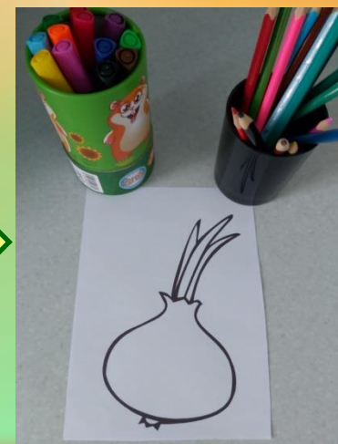
Картинки для разукрашивания